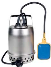
Sanisub Steel 50 A 3308815081700 SANISUBSTEEL-001

Zubehör für die Sanisub Steel finden Sie ab Seite 179