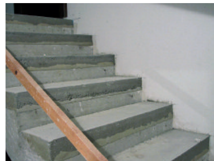
Aufgrund seiner Eigenschaften eignet sich PCI Novoment M3 plus auch hervorragend zum Höhenausgleich von Betontreppenstufen.