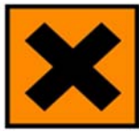
XI - Irritant