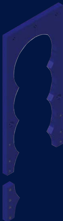
SIHGA® IdeFix® Bohrschablone IBS

Die runden Ausnehmungen an der SIHGA® Bohrschablone dienen als Führung für die SIHGA® Bohrlehre IBL und geben die mindest Achsabstände vor.