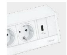
Weiß / weiß White / white