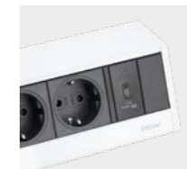
Weiß / schwarz White / black