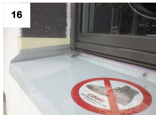
16 Isolation gemäss Abbildung anschliessen