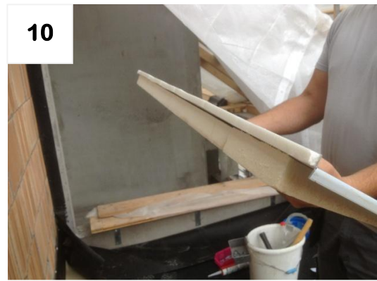
10 Dichtband anbringen