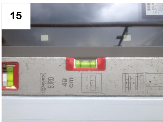
15 Kontrolle der Montagearbeiten