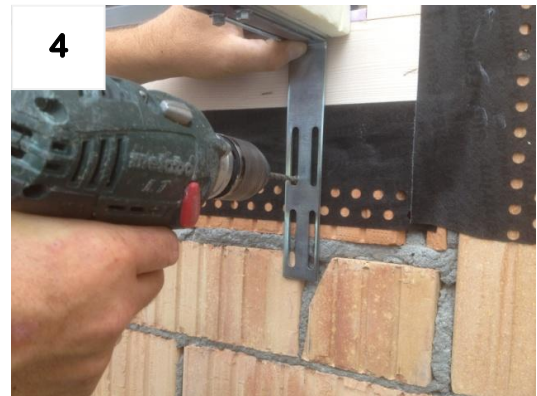
4 1x Montageloch bohren