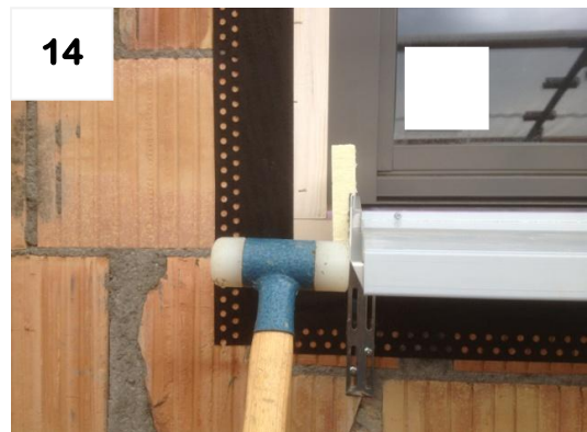
14 Schienen ausrichten (90° zum Fenster)