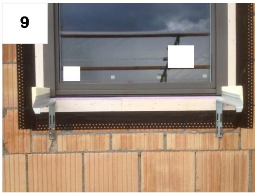
9 Schiene links: Punkte 3-8 wiederholen