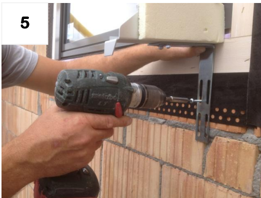
5 1x Schraube (provisorisch) fixieren