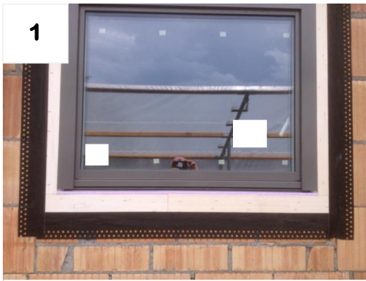
1 Ausgangslage: Fenster montiert + abgedichtet