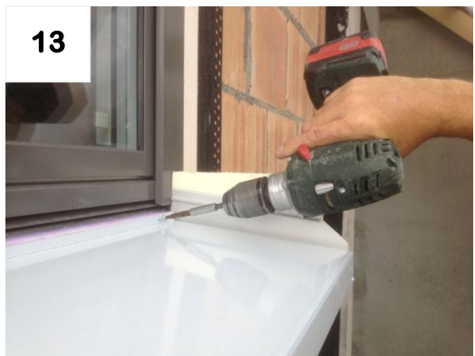
13 Bank „leicht“ anschrauben (muss beweglich bleiben)