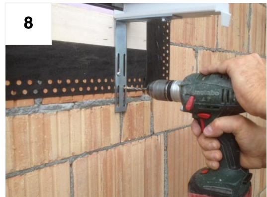
8 Zweites Loch bohren und Schraube fixieren