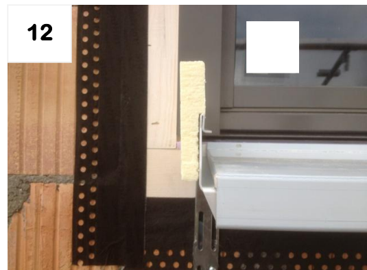
12 Fensterbank zwischen Schienen ausrichten