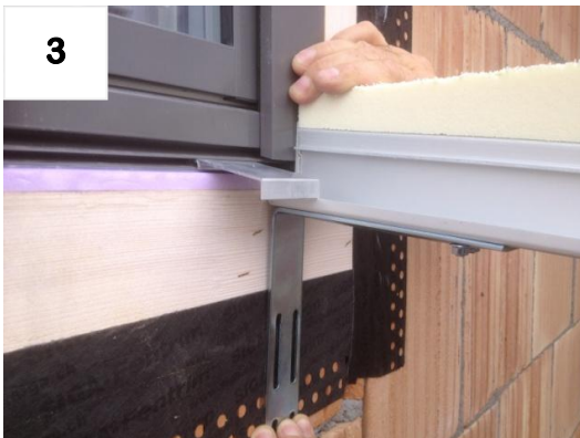
3 Montagehöhe mit Wetterschenkel definieren