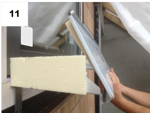
11 Fensterbank über Tropfnase einhängen