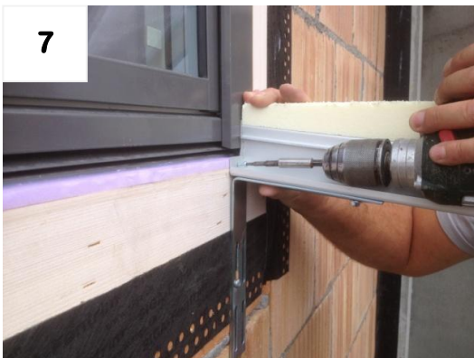
7 Schiene an Fensterrahmen schrauben