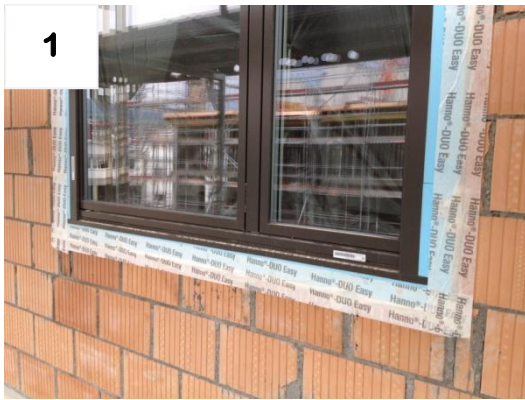
1 Ausgangslage: Fenster montiert + abgedichtet