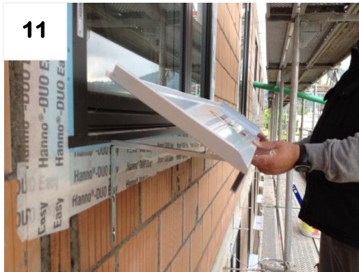
11 Fensterbank über Tropfnase einhängen