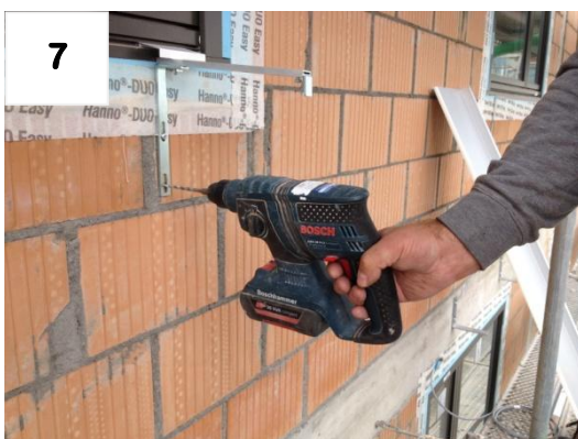
7 Zweites Loch bohren