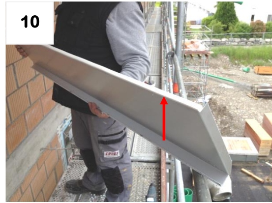
10 Dichtband anbringen