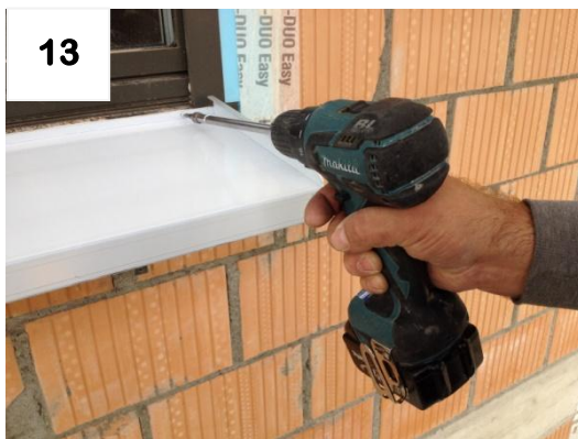
13 Bank „leicht“ anschrauben (muss beweglich bleiben)