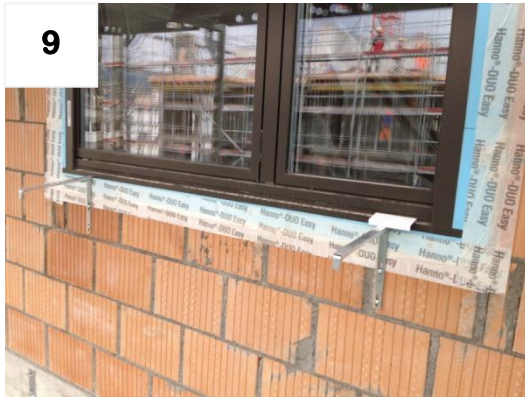
9 Bügel links: Punkte 3-8 wiederholen