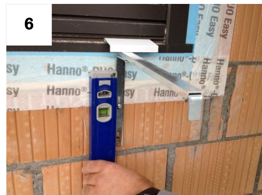
6 Bügel ausrichten und erste Schraube fixieren