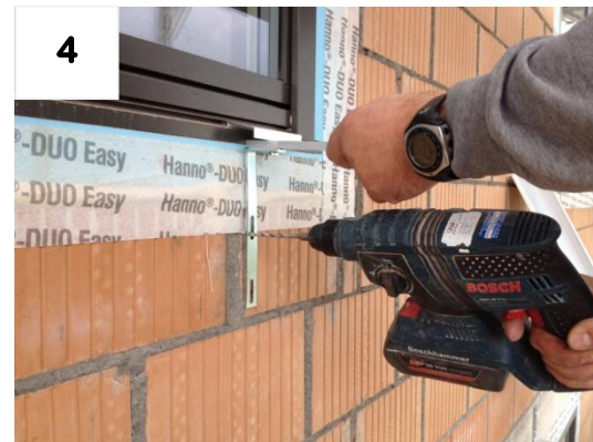
4 1x Montageloch bohren