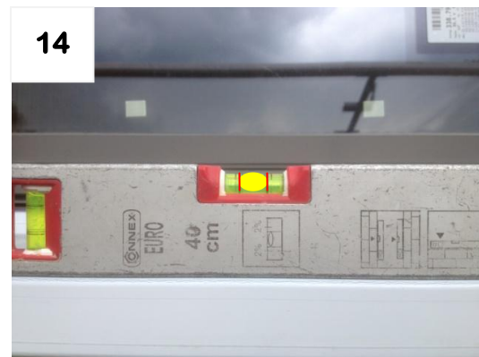
14 Kontrolle der Montagearbeiten