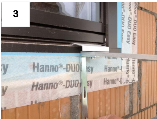
3 Montagehöhe mit Wetterschenkel definieren