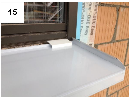
15 Einbauhöhe mit Wetterschenkel überprüfen (L+R)