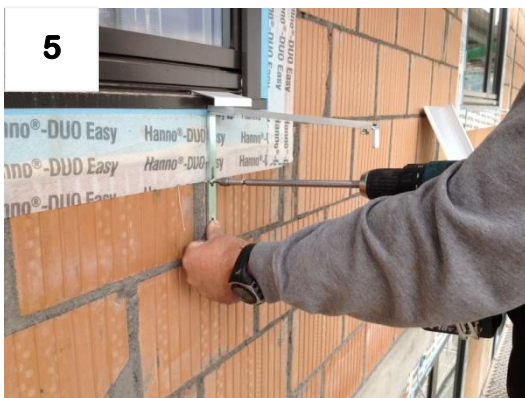
5 1x Schraube (provisorisch) fixieren