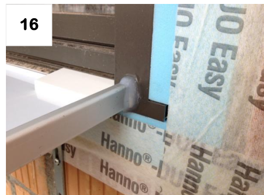
16 Seitlicher Fensterrahmen-Anschluss abdichten