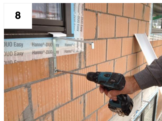
8 Zweite Schraube fixieren