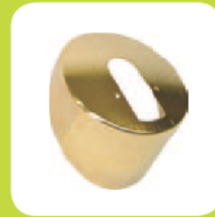
Abdeckung rund Edelstahl gold