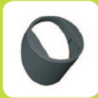
Abdeckung rund Kunststoff anthrazit bzw. weiß