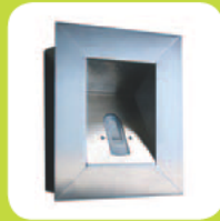
Wandeinbauset Edelstahl (vandalismushemmend)