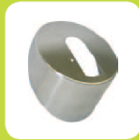
Abdeckung rund Edelstahl