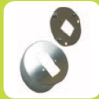
Abdeckung rund Edelstahl sec (vandalismushemmend)