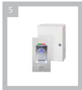
Art.-Nr. BK 680000