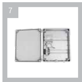
12 V Art.-Nr. 509-NKB.12 24 V Art.-Nr. 509-NKB.24