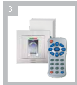
Art.-Nr. BK 720004