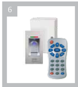
Art.-Nr. BK 690000