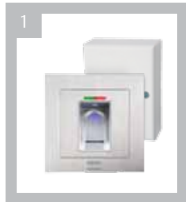
Art.-Nr. BK 700004