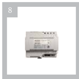
12 V Art.-Nr. NTH12-2.00 24 V Art.-Nr. NTH24-2.00