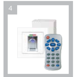
Art.-Nr. BK 720002