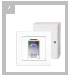
Art.-Nr. BK 700002