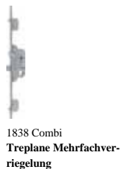
1838 Combi Treplane Mehrfachverriegelung