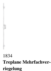
1834 Treplane Mehrfachverriegelung