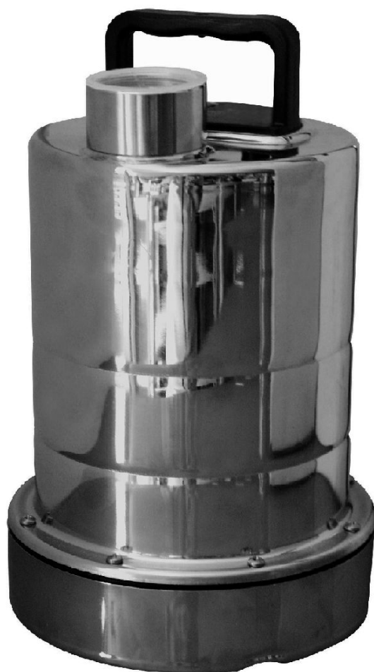
GT-Mini 160/7 GT-Maxi 200/9

Ⓛ Pompe submersible - Pompe de plongée 1-2 mm