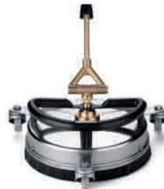
FR 30 ME