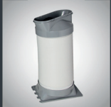
Schlauch: 1.5 m