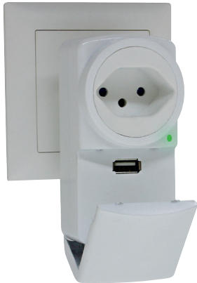
Steko Flip mit USB-Anschluss Steko Flip avec alimentation USB Steko Flip con alimentazione USB