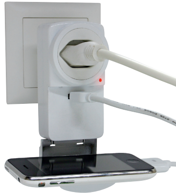
sichere anti-slip Ablage surface antidérapante piano sicuro antiscivolo