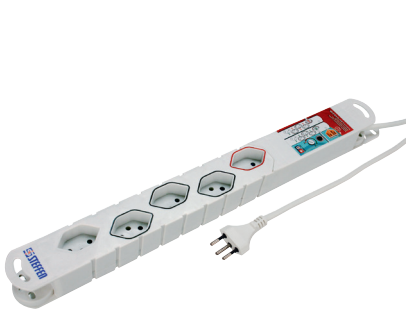
Steba Twist mit MasterSlave-Funktion Steba Twist avec fonction maître-esclave Steba Twist con funzione master slave