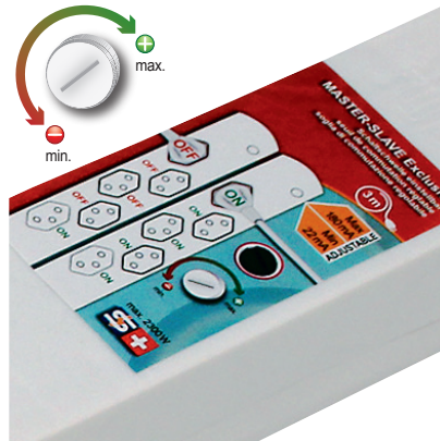
mit Schaltschwelle bis max. 180 mA avec seuil de commutation jusqu'à 180 mA con soglia di commutazione di max. 180 mA