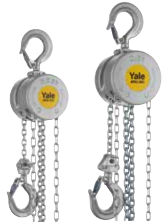
Tragfähigkeit 250 kg