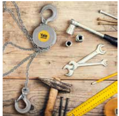
Tragfähigkeit 500 kg