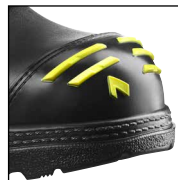
HAIX® High Durability Cap System