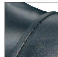
GÜK mit versenkten Nähten