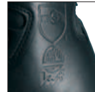
Schnitenschutz Level 1