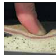
HAIX® MSL System