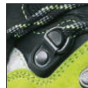
HAIX® 2-Zone Lacing