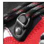
HAIX® 2-Zone Lacing