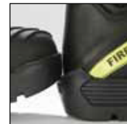
ES Out System