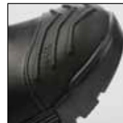
HD Cap System