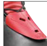
3Z Protector System