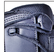
HAIX® Smart Lacing