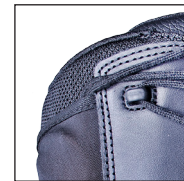
HAIX® Climate System