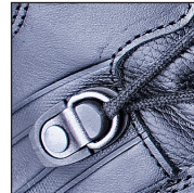
HAIX® 2-Zone Lacing