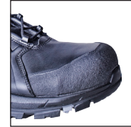
HAIX® Composite Schutzkappe