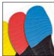
Vario Wide Fit System