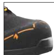
HAIX® Composite Schutzkappe