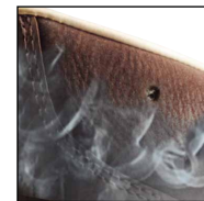
Système d'aération HAIX® Climate