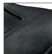
Protection de l'avant de la chaussure