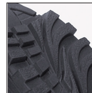
Semelle en TPU 3 phases