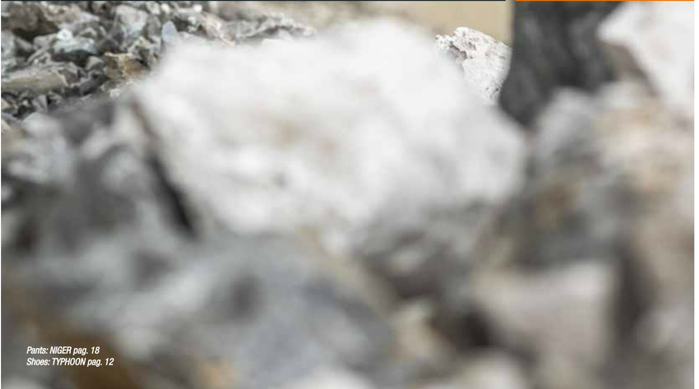
Pants: NIGER pag. 18 Shoes: TYPHOON pag. 12