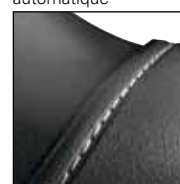
Protection de l'embout de sécurité avec encoche pour coutures