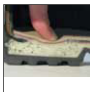
Système de mousse injectée HAIX® MSL