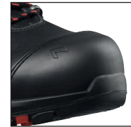
HAIX® Composite Schutzkappe