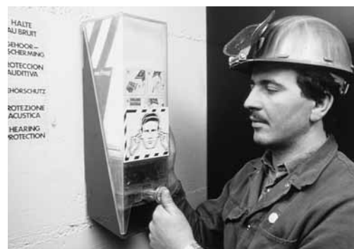
I protettori auricolari devono essere a portata di mano in qualsiasi momento.