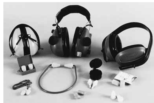
Serie di protettori auricolari.

Per ulteriori informazioni, consultare: – «La protezione individuale dell'udito» (codice 66096.i) – Lista di controllo «Dispositivi di protezione individuale (DPI)» (codice 67091.i) – «Lista di controllo per la scelta dei protettori auricolari» (codice: 86610.i) – Documentazione di vendita «Mezzi di protezione degli occhi e dell'udito» (codice: 88001.i) o www.suva.ch/prodotti-di-sicurezza