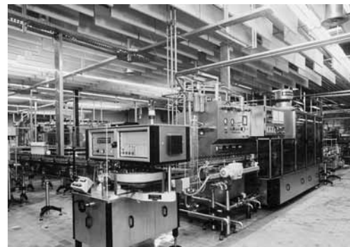
Baffle costituiti da pannelli di lana minerale in una ditta per bibite (impianto di imbottigliamento).

Per ulteriori informazioni, consultare: «Lotta contro il rumore nell'industria» (codice: 66076.i)