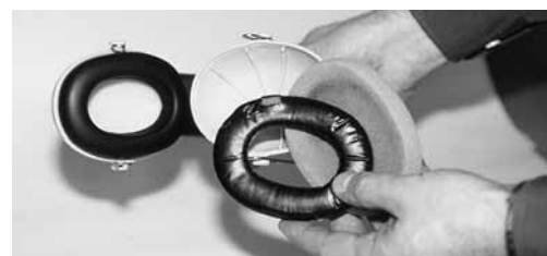
Usare e conservare accuratamente le cuffie anti-rumore.

Per ulteriori informazioni, consultare: «Come ha detto? Domande e risposte sul tema rumore» (codice: 84015.i).