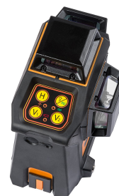
Geo6X GREEN SP KIT

» Multifonctionnel pour une variété d'applications de nivellement en design d'intérieur!