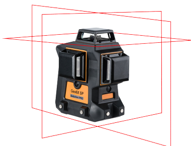
Geo6X SP KIT